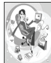
LA MANAGER IN CARRIERA