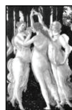
LA MUSA ISPIRATRICE