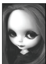
LA BAMBOLA DARK