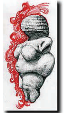
Venere di Willendorf Museo di Storia Naturale di Vienna (ca 23.000-19.000 a.C.), roccia calcarea, alt. cm 11

Inizieremo con l'universo femminile a cui è interamente dedicato questo numero. Diamo appuntamento al prossimo numero per quello maschile, ed al confronto fra i due in quello successivo.