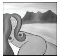
LA FEMME FATAL